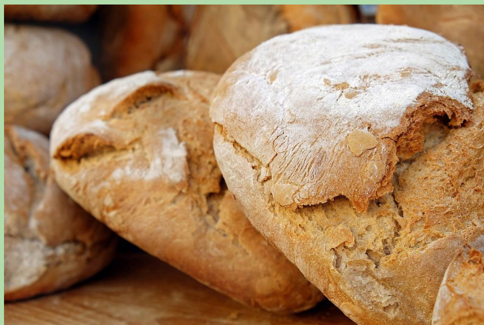
Echte Bakker Pots

De route gaat langs Echte Bakker Pots, de Dennenhoeve en Wout's Kwekerij. Onderweg kan je al je boodschappen bij elkaar verzamelen. Denk aan eieren, groente, fruit en brood. Maar ook broodbeleg, gebak en schoonmaakproducten. Daarbij biedt deze route voor elk wat wils. Zo is Kamp Westerbork een indrukwekkende stop voor geschiedenislijfhebbers en is de vogelkijkhut bij Diependal een leuke plek voor vogelaars. Een leuke fietsroute dus voor iedereen!