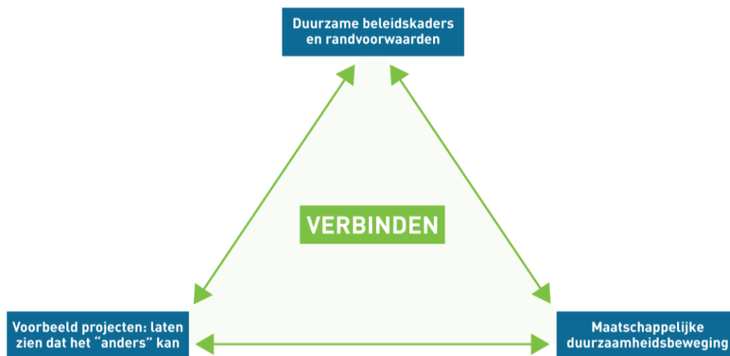
Figuur 1 - Werkwijze van de Natuur en Milieufederatie Drenthe